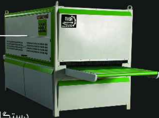
دستگاه سنباده زن O-Frame