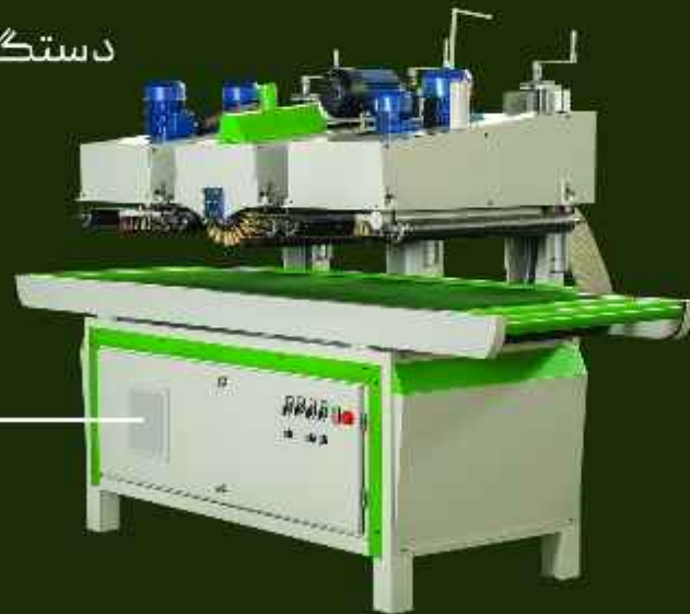
دستگاه سنباده زن C-Frame